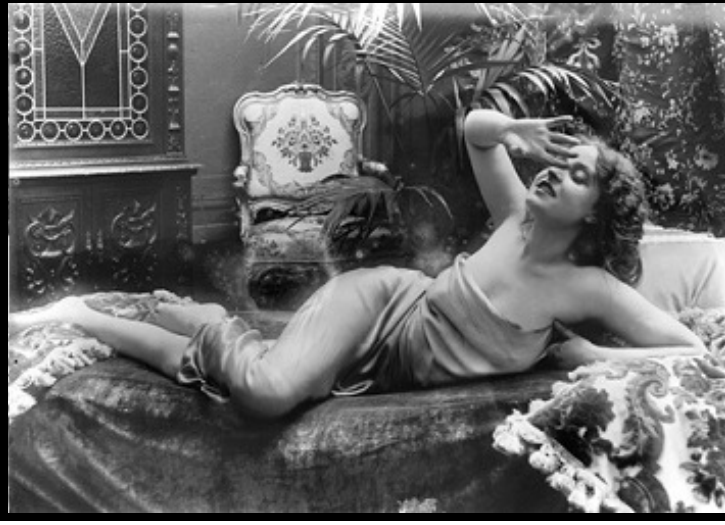
Resim 5. İtalyan aktris Pina Menichelli (1890-1984)

beklemektedir: Acaba bir "arzu nesnesi"ne dönüştürülen Menichelli'ye duyulan hayranlık ve imtina, tüm çelişkileriyle toplumsallaşan bir hâletiruhiyenin yansıması mıdır?