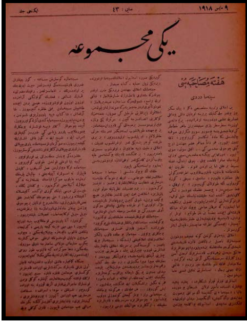
Resim 4. Refik Halid'in Yeni Mecmua'daki Sinema Derdi adlı yazısı, 1918.

baş başa muşakalar yapa yapa hayat zevk, keyf, refah içinde uzayub gitsin [...]” (Refik Halid [Karay], 1918: 320, 322).