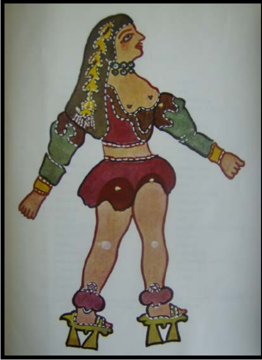
Resim 2. Kısa eteği ve dekoltesiyle Karagöz'deki "Soygun Çengi" karakteri (Sevin, 1968).

Sinemada müstehcenlik "müşterisi" olduğu sürece tüm yasal yaptırımlara ve toplumsal muhalefete rağmen bir yolunu bulup devam etmiştir. Filmlerin mahremiyeti yıkarak kadın ve çocuk gibi "savunmasız" addedilen seyirciler için bir "tehlike"ye dönüşebileceği kaygısı geç Osmanlı dönemi arşiv belgelerinde, basın ve edebî eserlerden takip edilebilir. Peki "sinemanın tehlikelerinin" tartışıldığı bu dönemde, Osmanlı eliti çocuklar ve sinema konusunda nasıl bir söylem geliştirmiştir?