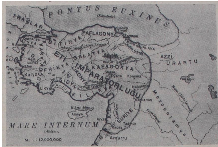
Harita.2: Cumhuriyet, 3 Ekim 1936, s.3.

Harita 2’nin tasarlanmasındaki esas amaç, yazıdan da anlaşılacağı gibi, Antakya-İskenderun bölgesinde ilk medeniyet kuranların Etiler olduğu tezini desteklemektir. Yazıda Etilerin Türk olduğu özellikle vurgulanmış, otokton olması itibarıyla de bölgenin esas sahiplerinin ilk medeniyeti kuran Türkler olduğu iddia edilmiştir. Söz konusu harita bu tezin görselleştirilmiş versiyonunu sunmaktadır.