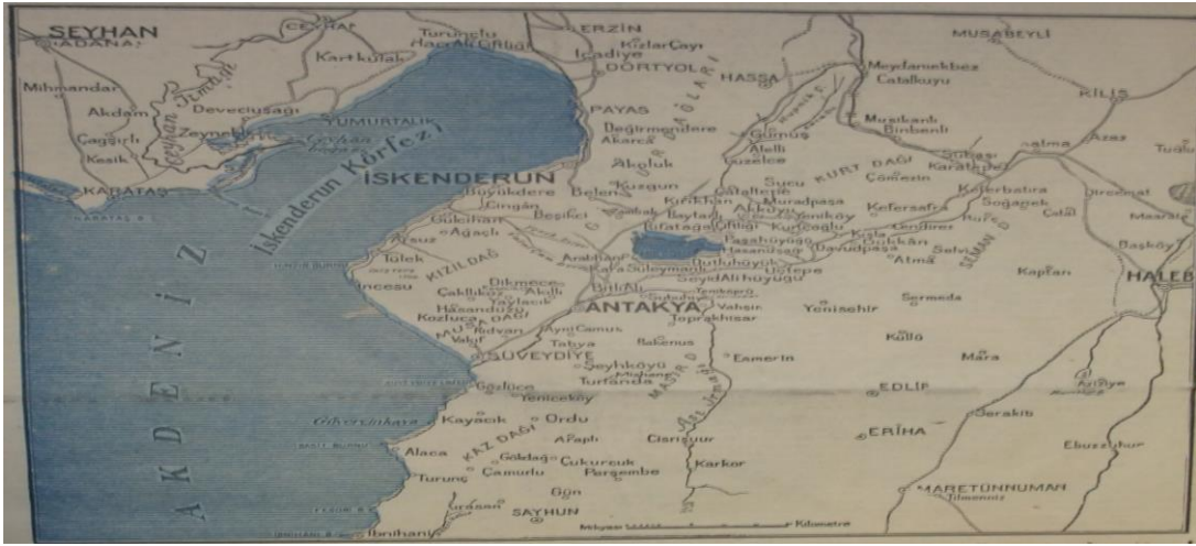
Harita.6: Tan , 1 Ocak 1937, s.11.

Harita 6'da bazı hususlar dikkat çekicidir. İlk göze çarpan hususlardan biri, İskenderun Sancağı ile Türkiye ve Suriye arasında herhangi bir sınır çizilmemiş olmasıdır. Halbuki bu türden bir haritada genellikle devlet sınırları da gösterilir. Bir diğer husus, bu harita yerleşim yerleri konusunda oldukça ayrıntılıdır, bölgedeki şehir, kasaba ve büyük köylerin yerleri belirtilmiştir. Yerleşim yerleri dışında yollar, akarsular ve göl de haritada gösterilmiştir. Haritada yer adları ve diğer coğrafi adlandırmalarda Türkçe kullanımına özen gösterilmesi dikkat çeken hususlar arasında yer almaktadır. Yayınlanan haritada bazı yer adlarının Türkçeleştirilmesinin yanı sıra bazı adlarda dikkat çekici değişiklikler yapıldığı da göze çarpmaktadır. Bu değişikliklerden biri, "Kürt Dağı" diye bilinen dağ