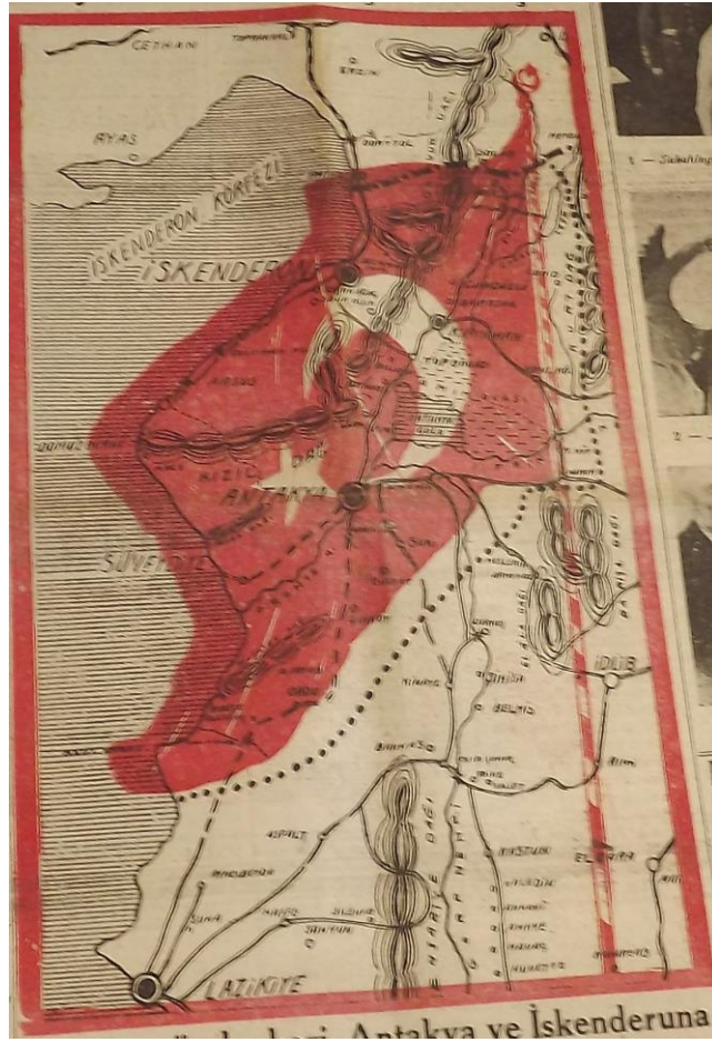
Harita.1: Açık Söz , 2 Ekim 1936, s.1.

Harita 1 dış politikada belli bir hedefin gerçekleştirilmesi amacına hizmet etmek üzere hazırlanmış görünmektedir. Bu amaçla haritada birtakım hususların ön plana çıkarıldığı görülmektedir. Öncelikle, söz konusu harita görsel unsurlar ve kullanılan adlandırmalarla bölgenin Türklüğünü vurgulamak suretiyle Türkiye'ye katılması tezini desteklemektedir. Buna ilave olarak, Sancağın sınırlarını çizmek suretiyle, Türkiye'deki okuyucuların bölgeye dair algılarının fiziksel mekanla örtüştürülmesine hizmet etmektedir. Başka bir ifadeyle, bu harita ile İskenderun Sancağı sınırları belirlenerek halkın bölgeye dair tahayyülü somutlaştırılmaya çalışılmaktadır.