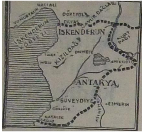
Harita.7: Tan , 17 Şubat 1937, s.1.

Harita 7 üzerindeki adlandırmalarda Türkçe kullanılmasına özen gösterilmiştir. Ayrıca İskenderun Sancağı'nı Türkiye ve Suriye'den ayıran sınırı göstermek için kesik kesik kalın çizgiler kullanılmıştır. Böylece Sancağın hangi bölgeleri kapsadığı net bir biçimde belirlenmiş oldu. Sınırların bu şekilde net bir biçimde ortaya konulması, söz konusu bölgenin sınırlarının tayin edilerek okuyucunun kafasında daha da somutlaştırılmasını sağlamıştır. Sınırların çizilmesinin bunun dışında da bir işlevi yerine getirdiği söylenebilir. Haritaya bakıldığında İskenderun Sancağı hem Türkiye'den hem de Suriye'den tamamen bağımsızmış gibi bir izlenim oluşuyor. Halbuki Milletler Cemiyeti tarafından 27 Ocak'ta kabul edilen rapora göre İskenderun Sancağı'nın içişlerinde bağımsız, dışişlerinde ise Suriye'ye bağlı "ayrı bir varlık" olması öngörülmekteydi